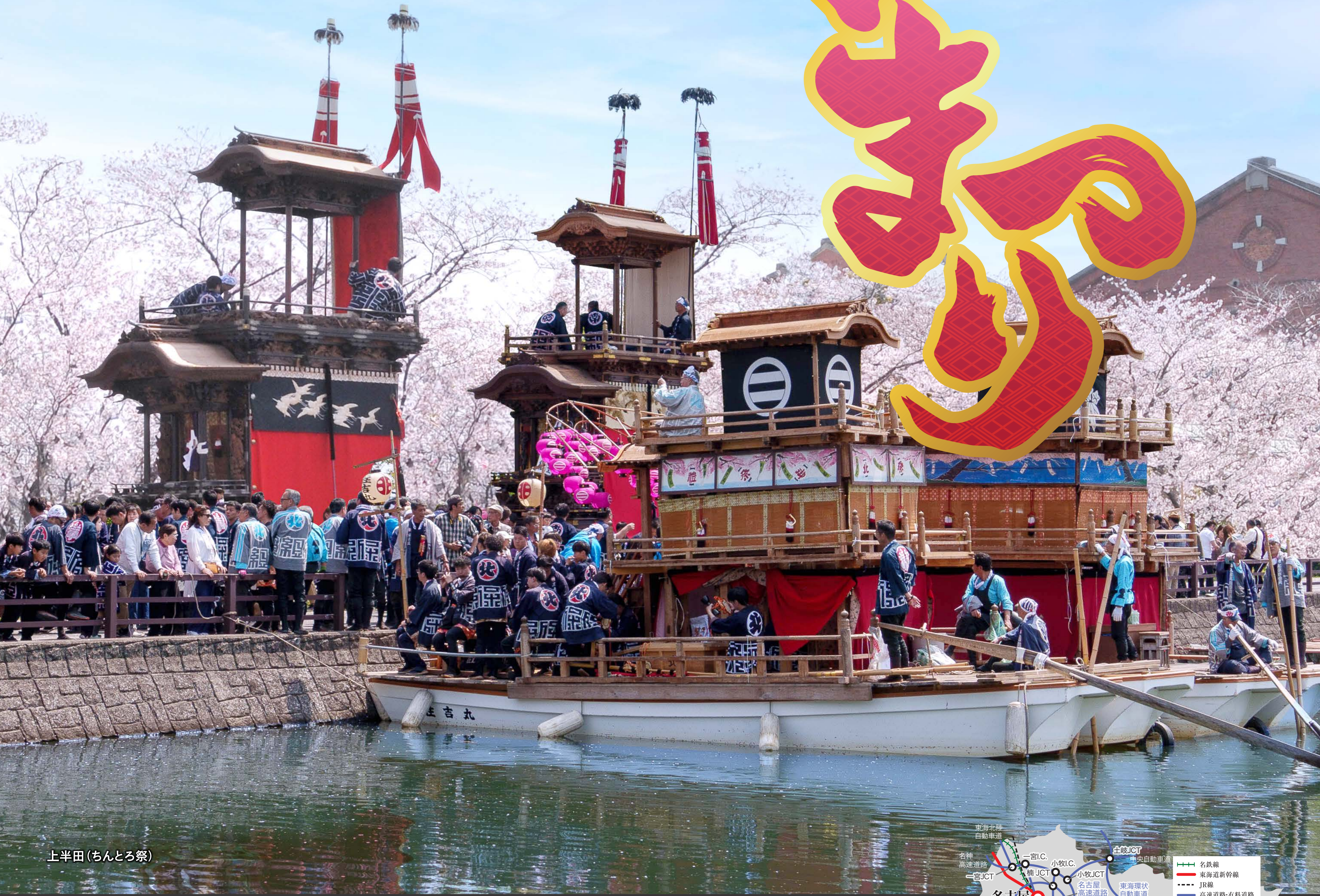
上半田(ちんところ祭)